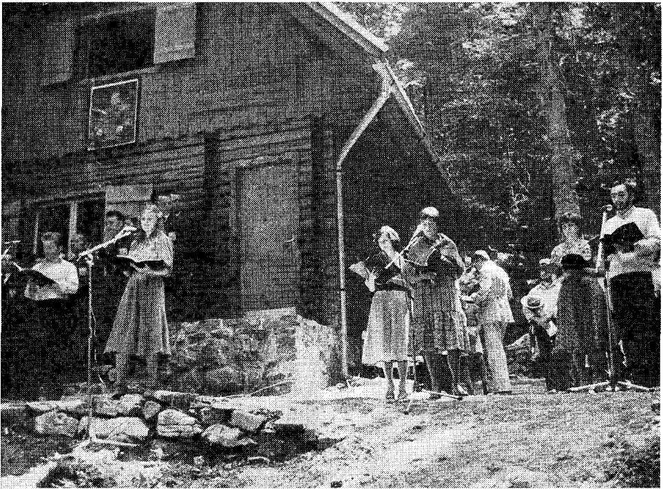
Na prireditvi so sodelovali člani KUD Kliničnega centra in Medicinske fakultete dr. Lojz Kraigher iz Ljubljane.