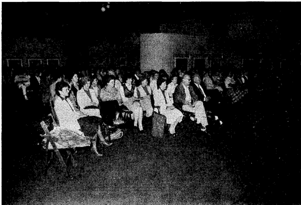
Srečanje operacijskih medicinskih sester je potekalo v Umetnostni galeriji

Program strokovnega srečanja se je začel 23. septembra zvečer z družabnim srečanjem, kjer so se lahko kolegice v prijetnem in prijateljskem vzdušju pogovorile o marsikateri strokovni zadevi, rešile osebne dileme in izmenjale strokovne izkušnje.