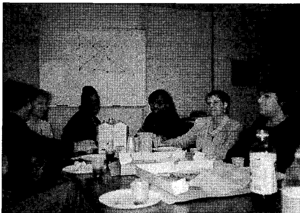
Sl. 2. Potek dela na terenu.

Potepale smo se tudi po mestu in si ogledovale njegove zanimivosti (nacionalni indijanski muzej, kip Svobode,