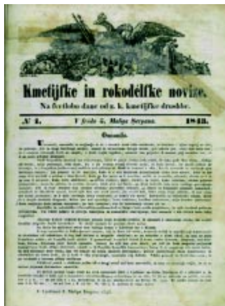
Kmetijske in rokodelske novice (1843–1902)