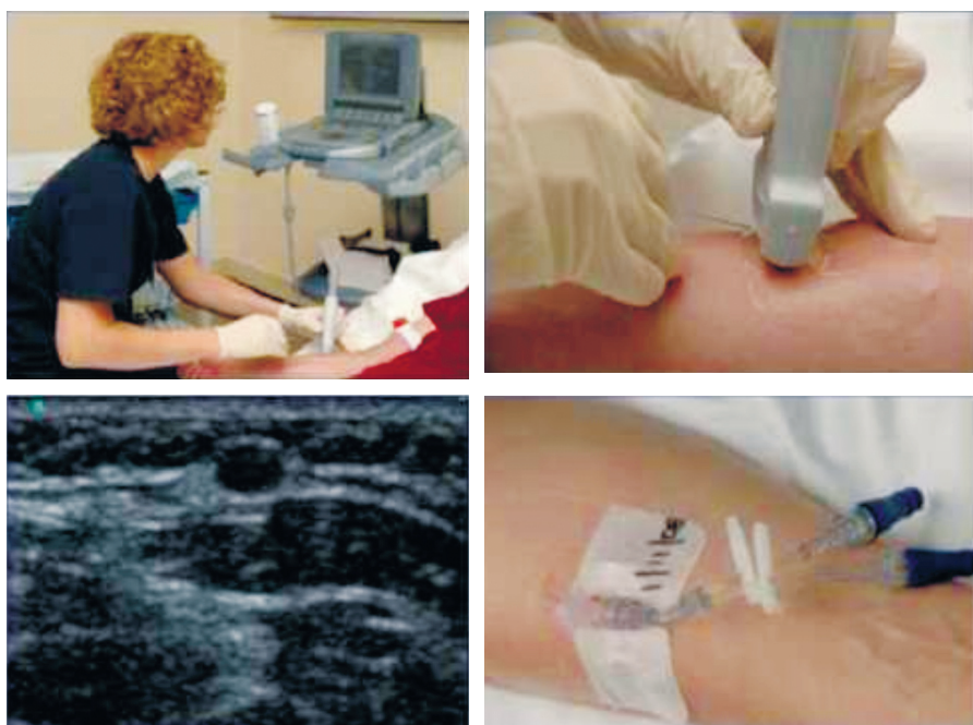
Sl. 3. Postopek VIK z UZ-vodenjem (Walker, 2009).

Podobno je pri dojenčkih, kjer je VIK prav tako težje izvedljivo. Nedavna raziskava v pediatrični bolnišnici v ZDA je pokazala, da se je za vsako uspešno VIK porabilo približno pol ure (33 minut) ter 2,2 vboda. Prvi poskus VIK je bil uspešen pri manj kot polovici (45%), pri več kot tretjini pa VIK ni bilo