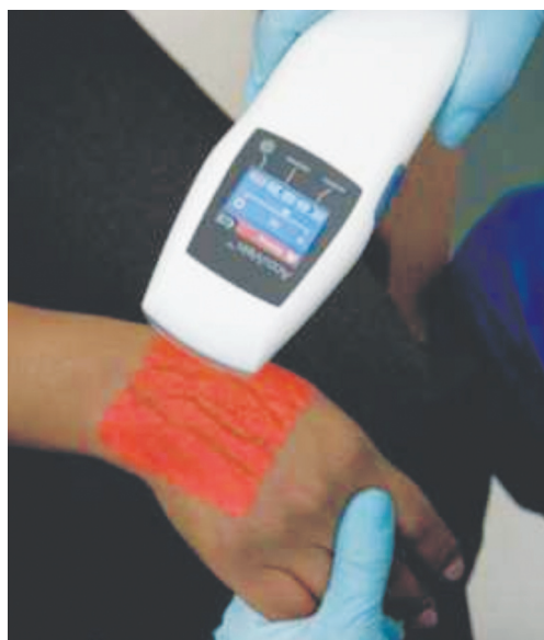
Sl. 2. Naprava AV300 za iskanje perifernega ožilja z infrardečim valovanjem (AccuVein, 2010a).

Pri bolnikih, pri katerih je i.v. kanila težje vstavljiva, smo do sedaj uporabljali tako imenovani slepi način (Walker, 2009). Primerjava med slepim VIK in VIK z UZ-vodenjem je