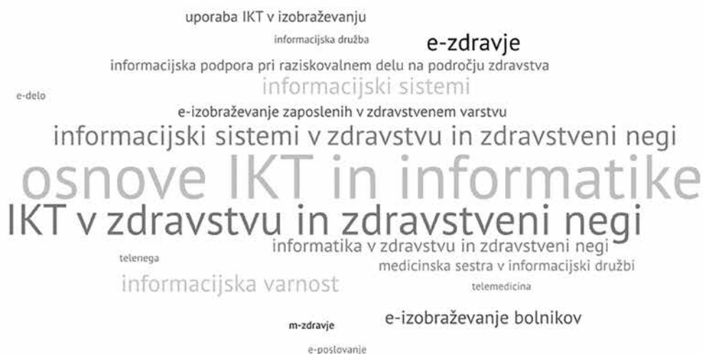
Slika 2: Vsebine izbranih predmetov na 1. stopnji ( n = 9 )