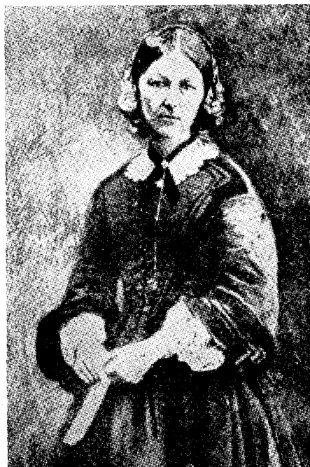
Portret Florence Nightingale po vrnitvi s Krima. Na obrazu so dobro vidni sledovi prestanih naporov in trpljenja. (Portret izdelan po naročilu kraljice Viktorije.)

v zvezi z vzgojo učenk, mora biti v pristojnosti voditeljice šole (voditeljica šole je tedaj bila hkrati tudi matrona, t. j. glavna sestra bolnišnice — op. pis.).