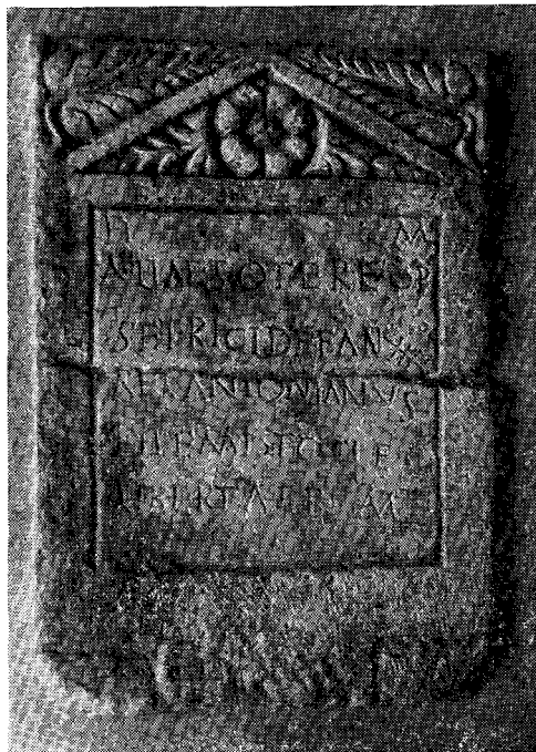
1700 let star nagrobnik babice iz Solina pri Splitu

Nagrobni kamen je v zgodovini našega porodništva zelo pomemben, ker dokazuje, da smo imeli babice že v 3. stoletju po našem štetju. Babiške šole pa smo dobili mnogo pozneje. Prva je začela delovati leta 1753 v Ljubljani.