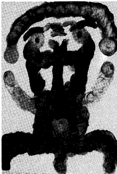
Naslov teme: Svet okoli mene – ogrožujoče doživljanje ljudi in situacij pri depresivnem oziroma suicidalnem pacientu

Tekom dopoldneva potekajo vse druge aktivnosti zaposlitvene terapije :