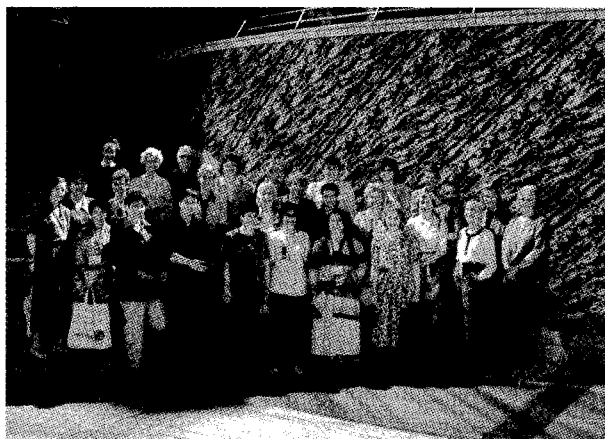
Delovna skupina evropskih medicinskih sester-raziskovalk (WENR).

V dneh od 3. do 5. junija 1995 je bilo v Atenah že 18. redno letno zasedanje delovne skupine evropskih medicinskih sester-raziskovalk (WENR). Udeležile so se ga predstavnice Društev medicinskih sester iz dvajsetih evropskih držav. Temeljni namen delovanja WENR je pospeševanje raziskovalnega dela na področju zdravstvene nege ter po-