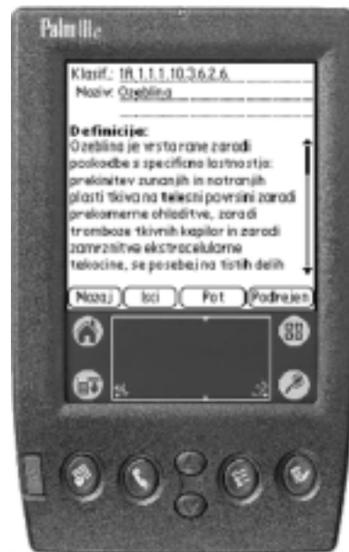
Sl. 2. Izpis definicije fenomena zdravstvene nege na dlančniku.

Verzija na dlančniku (sl. 2) je osnovana na operacijskem sistemu Palm. Izkorišča znane prednosti dlančnikov, kot so priročnost, hiter vklop, raznovrstni vmesniki ipd. Predvsem pa ima dlančnik lahko medicinska sestra v žepu in s tem ICNP vedno pri roki. Seveda pa so tu tudi omejitve, ki se kažejo predvsem v hitrosti in majhnem zaslonu.