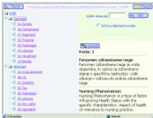
Sl. 3. Prikaz strani pregledovalnika na internetu.

Pregledovalnik je dosegljiv na omrežnem naslovu: http://lopes1.fov.uni-mb.si/ICNP (potrebujete Internet Explorer 5 ali višjo verzijo). Primer zaslonske slike prikazuje slika 3.